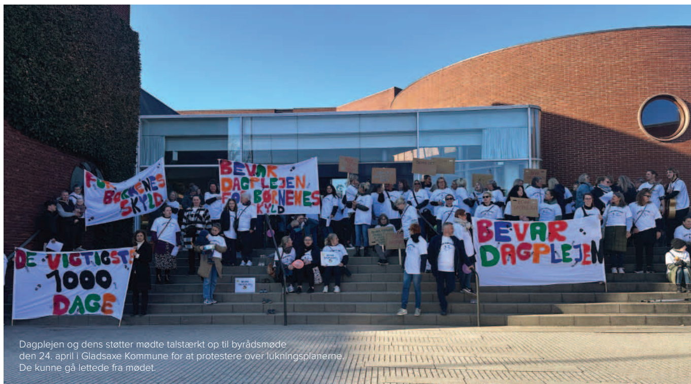
Dagplejen og dens støtter mødte talstærkt op til byrådsmøde den 24. april i Gladsaxe Kommune for at protestere over lukningsplanerne. De kunne gå lettede fra mødet.

”Det var bare tydeligt, at de ikke havde tænkt det ordentligt igennem, for det giver ikke mening at nedlægge et velfungerende pasningstilbud med kæmpestor brugertilfredshed, når målet er at sikre