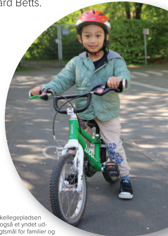
Cykellegepladsen er også et yndet udflugtsmål for familier og ikke mindst turister. Her er det især genialt, at man både kan låne cykel og hjelm.

”Jeg aflæser barnets kropssprog og mik for at få en fornemmelse af, hvordan det har det i situationen. Jeg vil helst observere barnet på en løbecykel for at få en fornemmelse af, hvor god balancen er. Man kan opdele børn i to kasser: Er det en tænker eller en bullerbasse. Tænkeren skal have mere støtte og psykologisk skub i ryggen, bullerbassen skal bare have nogle tips, og så kører det. Vi ken-